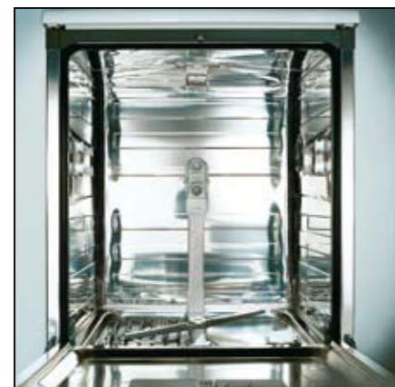
CUBA ENVOLVENTE EN ACERO INOX

La estructura de los nuevos lavavajillas Otsein Hoover, caracterizada por la cuba envolvente en acero inox y del doble de espesor que el cualquier otro lavavajillas del mercado, ofrece una mayor resistencia al paso del tiempo a la vez que una mayor limpieza y menor rumorosidad. Este aspecto sitúa a los lavavajillas Otsein Hoover entre los más fiables del mercado a la vez que ofrece una presencia incomparable: ¡Acero Inox por los cuatro costados!